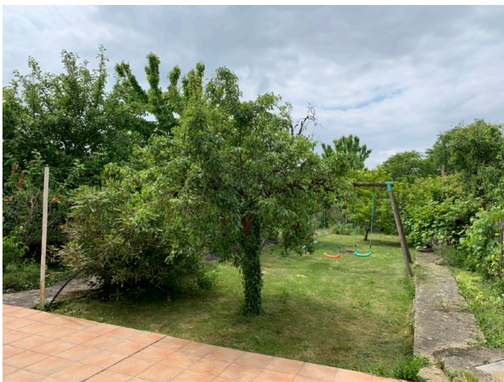
Jardin vu de l'arrière de la Maison

« Que chacun donne comme il l'a résolu en son coeur, sans tristesse ni contrainte ; car Dieu aime celui qui donne avec joie. Et Dieu peut vous combler de toutes sortes de grâces, afin que, possédant toujours en toutes choses de quoi satisfaire à tous vos besoins, vous ayez encore en abondance pour toute bonne oeuvre, selon qu'il est écrit : Il a fait des largesses, il a donné aux indigents ; Sa justice subsiste à jamais. » II Corinthiens 9, 7-9