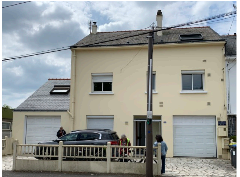
Façade avant de la Maison

La maison et le terrain permettent d'une part de loger notre pasteur, et d'autre part de disposer d'une salle de réunion qui nous appartient. Nous pourrions alors organiser d'autres activités et rayonner sur un nouveau quartier.